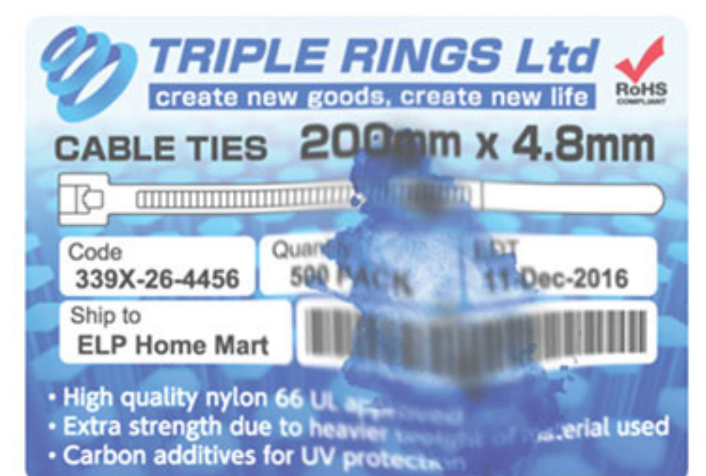
หมึกทั่วไป

หมึกออปชั่นไม่ละลายในน้ำ และยึดแน่นกับเส้นใยของวัสดุงานพิมพ์อย่างแน่นหนา ทนทาน ความชื้นและอื่นๆ