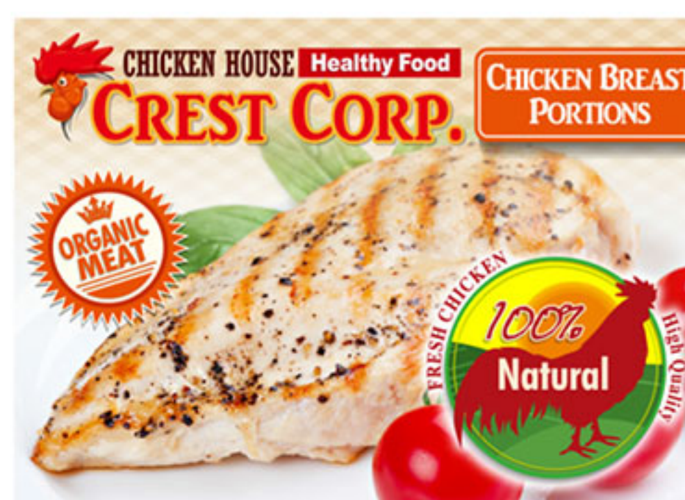
ฉลากอาหารและเครื่องดื่ม