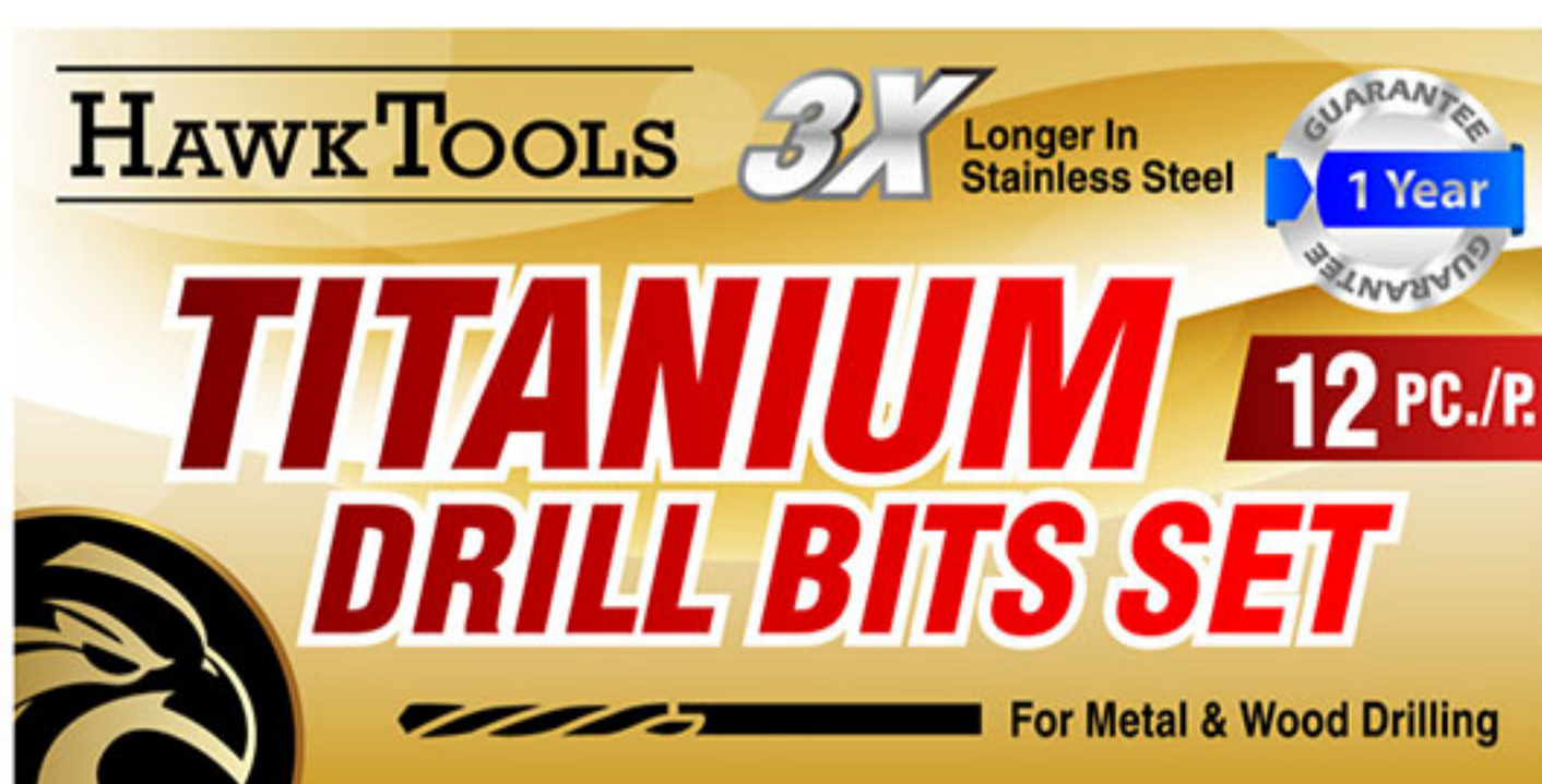
ฉลากอุตสาหกรรม

ค่า dpi ที่สูงกว่า ทำให้งานพิมพ์มีความคมชัด แม่นยำ และเก็บรายละเอียดได้มากขึ้น ให้ความละเอียดการพิมพ์สูงถึง 1200 dpi มาพร้อมเทคโนโลยีที่ปรับขนาดหยดหมึกได้และจับคู่สีเฉพาะจุด* ทำให้ภาพคมชัด แม่นยำ เครื่องพิมพ์เอปสัน ColorWorks C6050A/P และ C6550A/P ให้งานพิมพ์ที่สวยงาม และมีประสิทธิภาพ